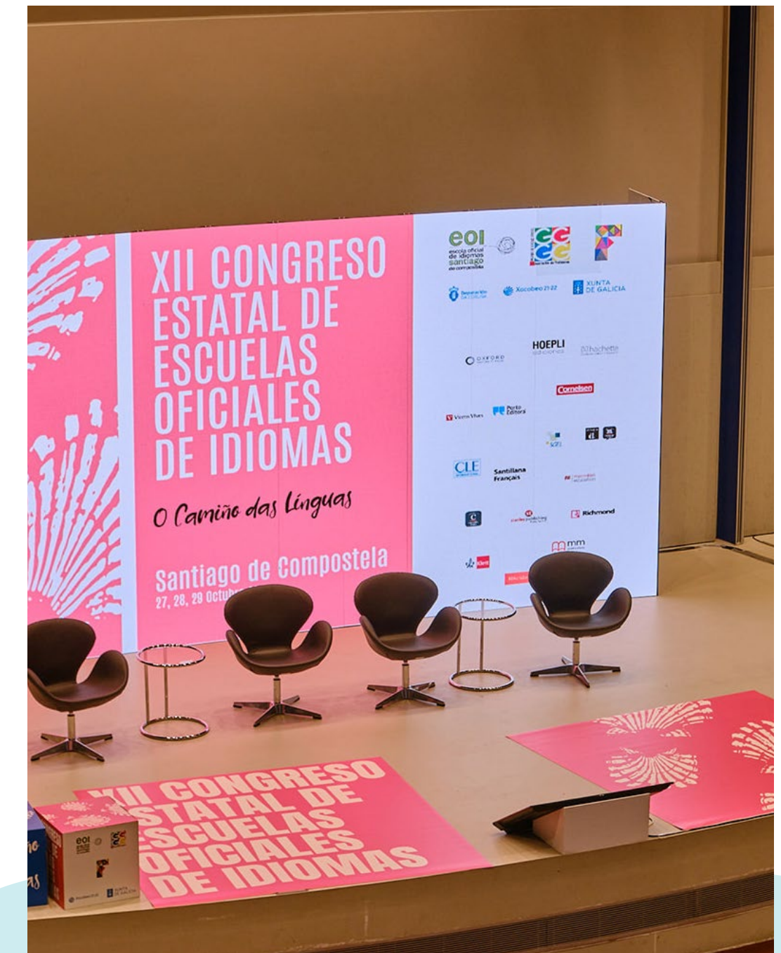
Congresos y convenciones