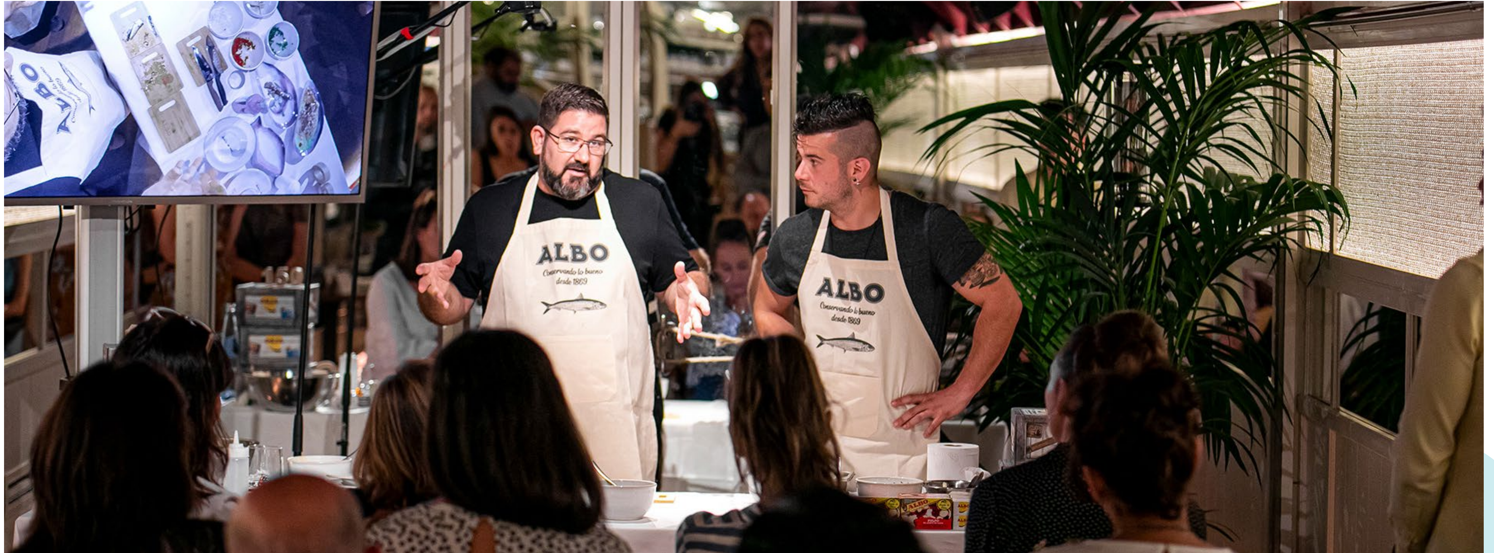
Eventos de celebración del 150 aniversario de Conservas Albo en Madrid: Showcooking + Clase Magistral y Evento Social con el Chef Dani García como embajador.