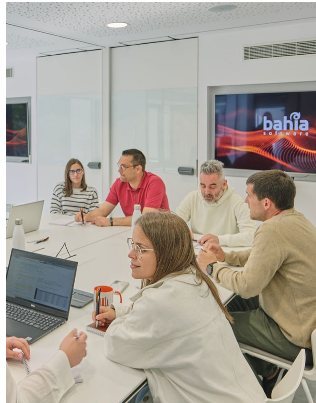
Experiencias de equipo