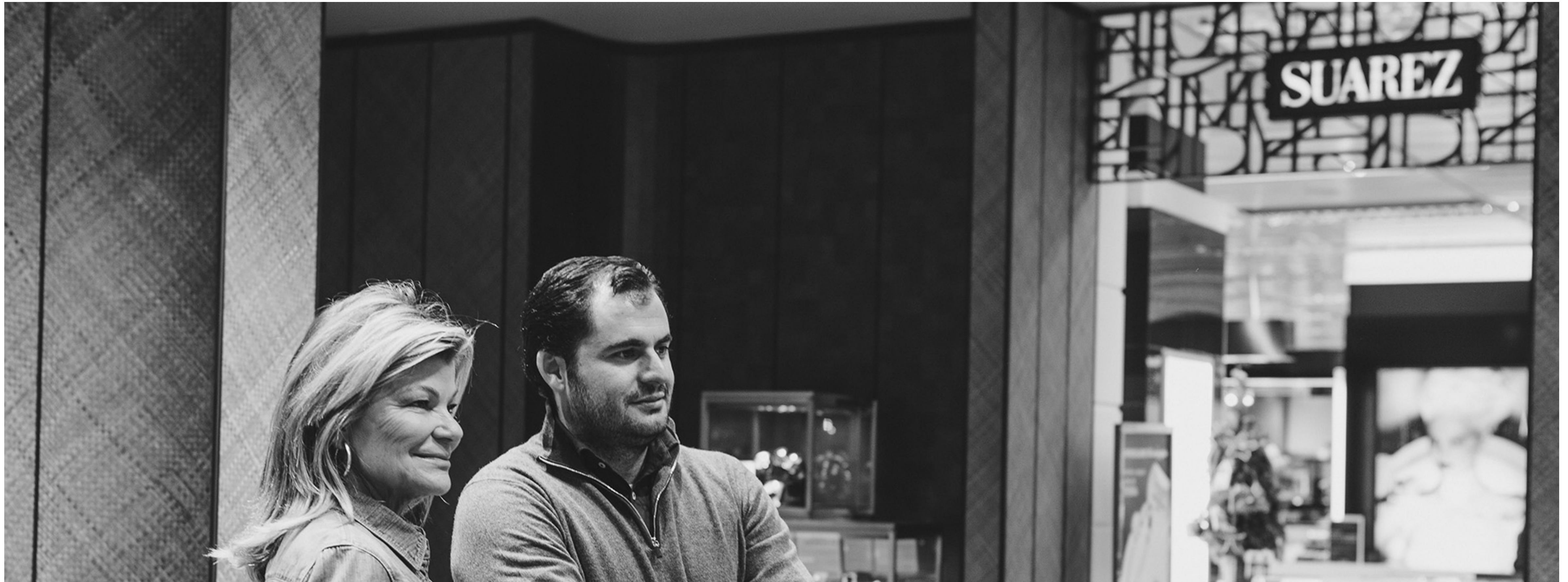
Joyería Suárez. Evento presentación de primer punto de venta en Galicia.