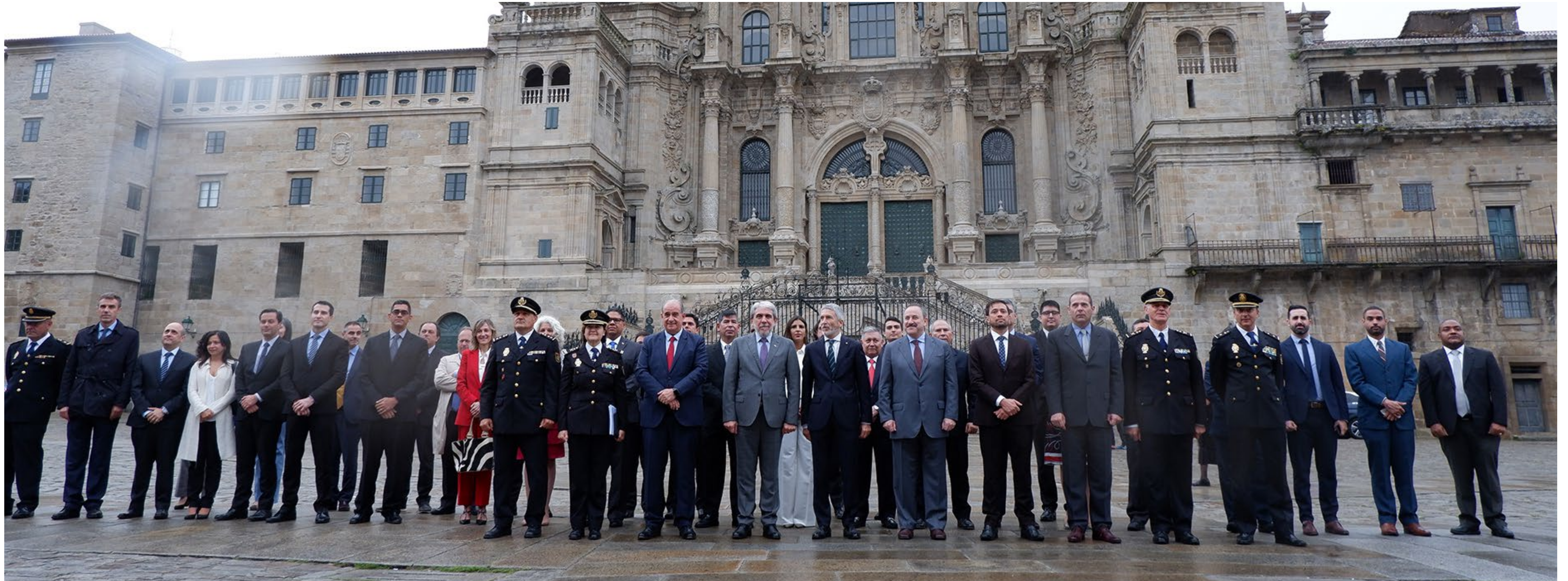
FIIAPP. Reunión de diálogo y debate del tratado constitutivo de AMERIPOL - Comunidad de Policías de América