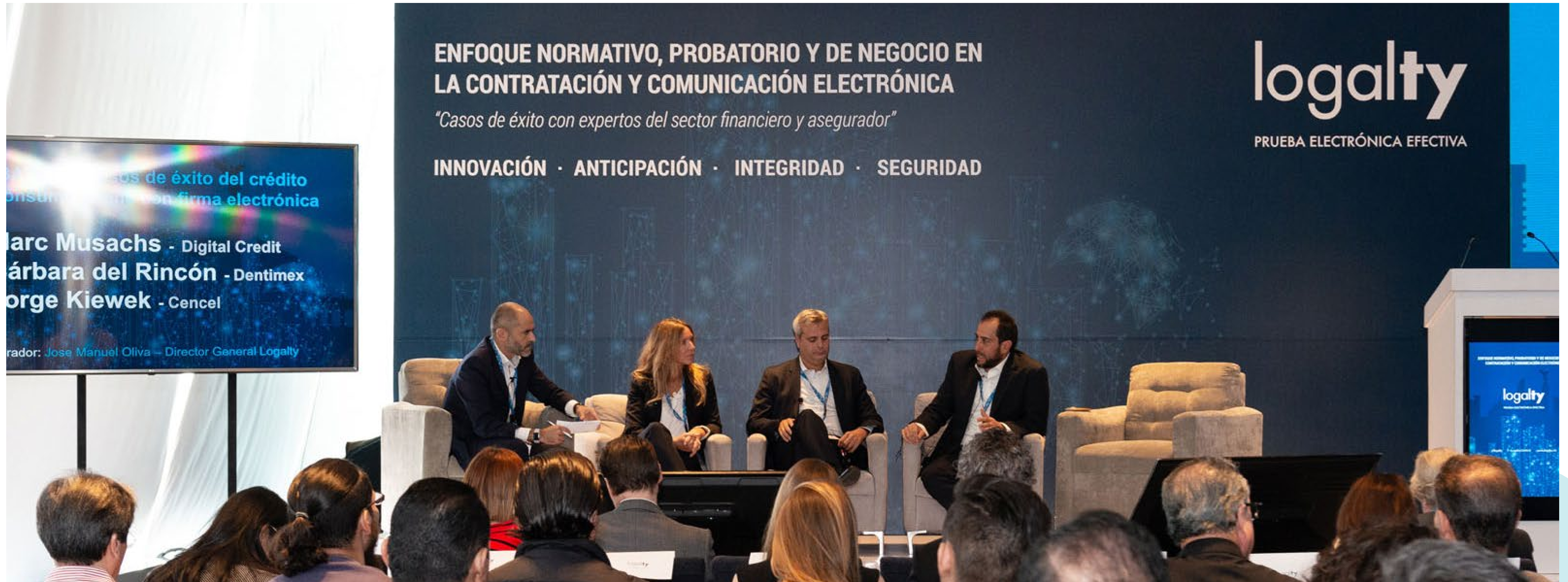
Evento Logalty en Ciudad de México. Presentación de la compañía en el País ante directivos de empresas top 30 del país (Facebook, Google, Mercado Libre, etc.)