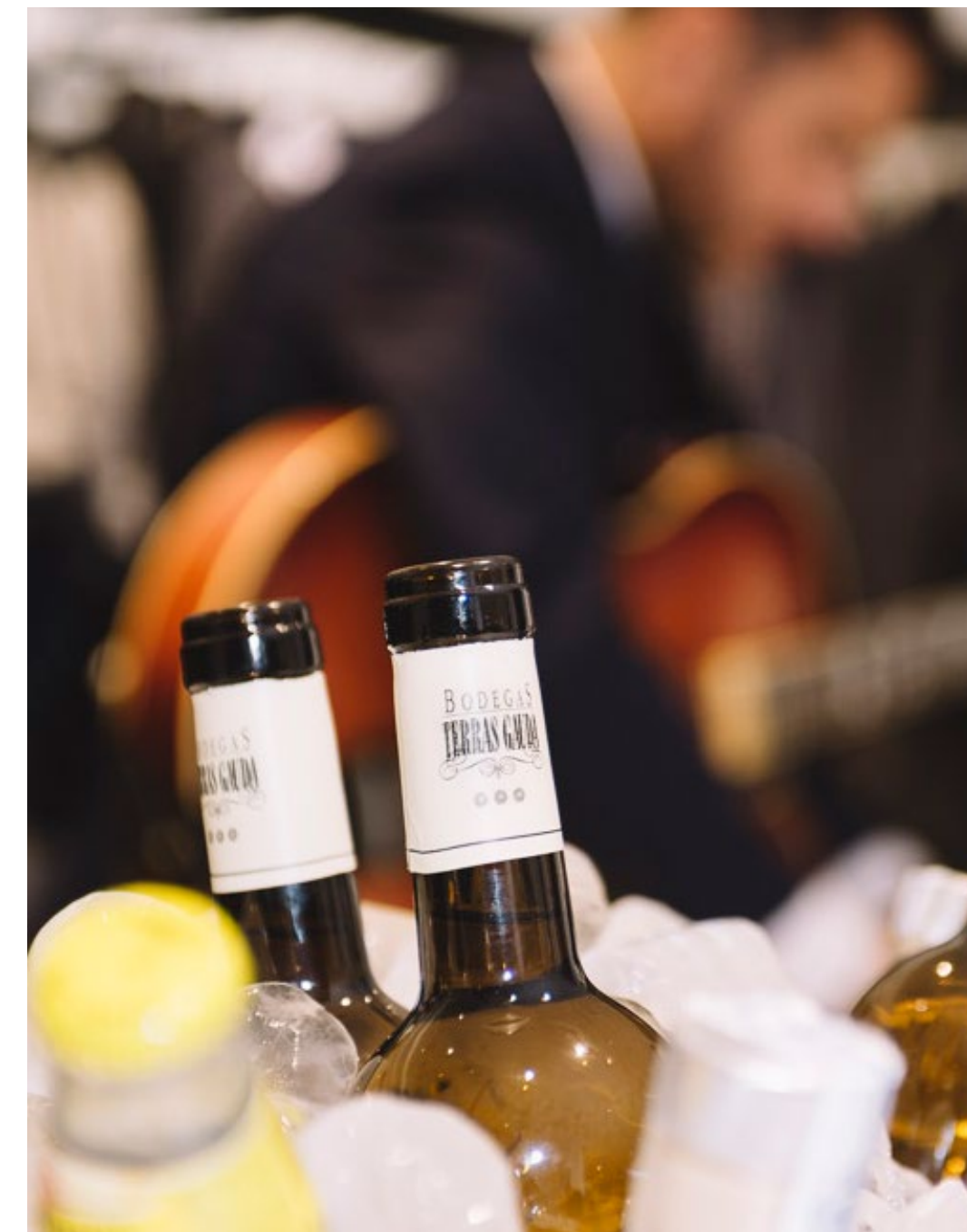
Experiencias de marca